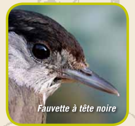
Fauvette à tête noire