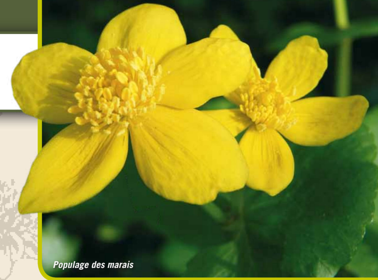
Populage des marais

LA RÉSERVE NATURELLE NATAGORA DE SAINT-REMY-GEEST, D'UNE SUPERFICIE D'ENVIRON 1 HECTARE, EST SITUÉE DANS LE BEAU VALLON DU GOBERTANGE, UN AFFLUENT DE LA GRANDE GETTE. CETTE PARTIE FORT MARÉCAGEUSE DU VALLON EST ALIMENTÉE PAR UN PETIT RUISSELET PRENANT SES SOURCES À QUELQUES MÈTRES DE LA RÉSERVE : LA TRISLAINE.