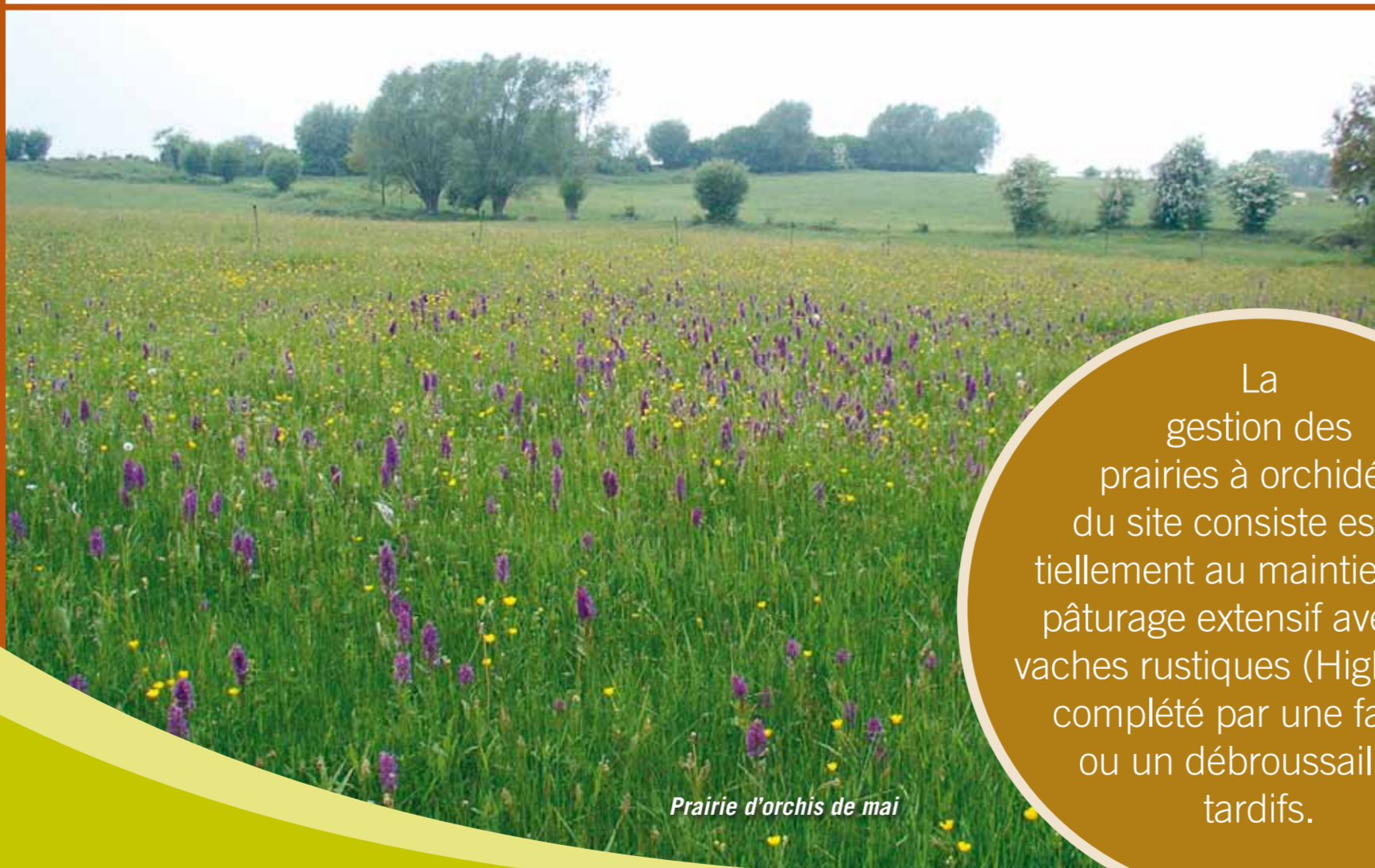
Prairie d'orchis de mai

Les prairies sont alimentées par différents suintements et une petite source permanente. Elles recueillent aussi les écoulements d'eaux des collines avoisinantes. On constate des différences significatives d'humidité des sols, traduites au niveau de la végétation, l'humidité du site se renforçant dans la partie basse du vallon, la partie nord de la réserve étant même fangeuse. Ainsi, les différentes associations végétales observées vont de la prairie pauvre assez sèche à rhinante ( Rhinanthus minor ) à la roselière fort humide à massette ( Typha latifolia ), en passant par divers types de prairies hygrophiles. Ces prés humides comportent des espèces végétales fort intéressantes, telles la laïche distique ( Carex disticha ), le jonc acutiflore ( Juncus acutiflorus ) et surtout l'orchis de mai ( Dactylorhiza majalis ), une orchidée protégée dont plusieurs milliers de plants fleurissent début mai dans la réserve. On observe également quelques pieds d'une seconde orchidée, l'orchis tacheté ( Dactylorhiza maculata ), fleurissant en juin.