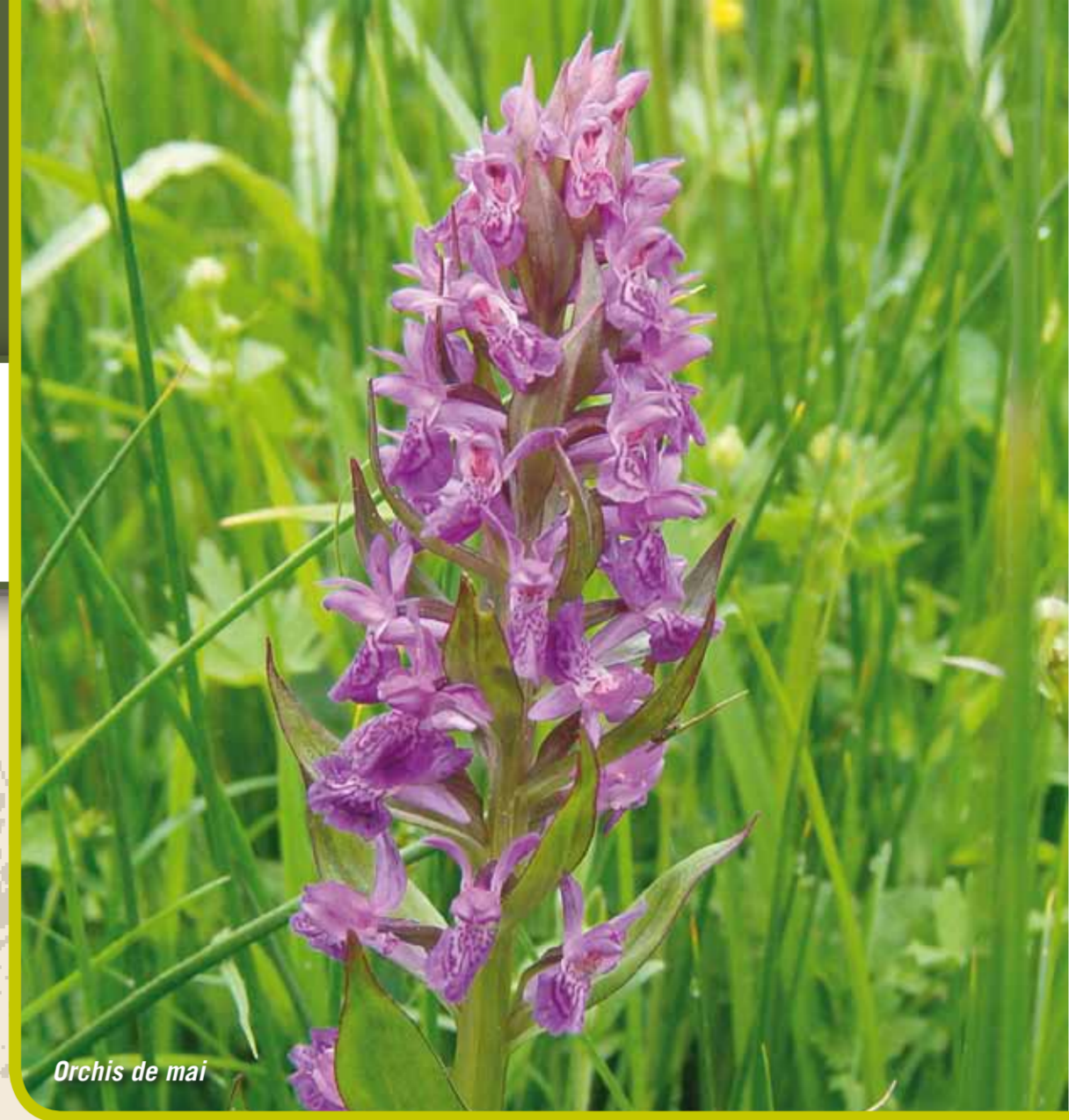
Orchis de mai