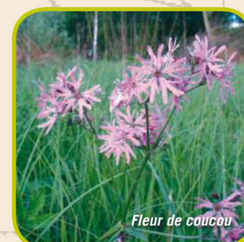
Fleur de coucou